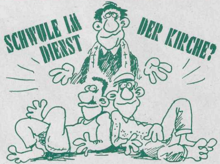
Einem Teil unserer Auflage liegt eine Information des Forums der Nürnberger Schwulengruppen bei.