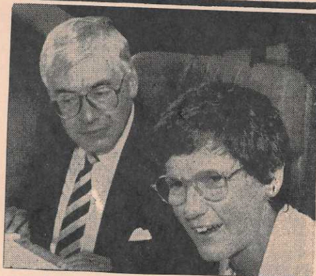
Bundesgesundheitsministerin Süssmuth neben ihrem Amtskollegen Schwarz-Schilling